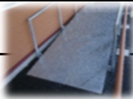
勾配の違う坂道と階段