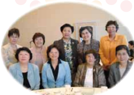
有田日本看護連盟顧問も参加