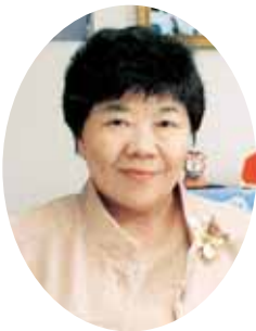
大分県看護協会会長