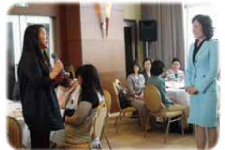
参加者との質疑応答