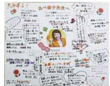
会員より 必勝を祈りエールを送る

今回の総選挙を終え、自民党は新たな一步を踏み出すことになりました。環境や条件は以前とは変化するかもしれませんが、国政の場に送り出された以上、引き続き看護界における諸課題の解決に向けて責任を持って全力で頑張っまいりますので、今後とも皆様の温かいご支援を賜りたく心よりお願い申し上げます。