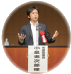
小泉進次郎先生の特別講演

「ポリナビワークショップ in 熊本」に参加して (日時)平成23年10月31日(月)13:00~16:00 (会場)ホテル熊本テルサ「テルサホール」