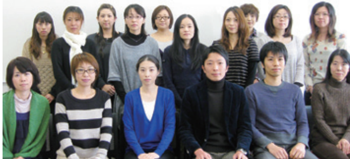
若手会員委員会のメンバー

平成20年の夏に発足し、3年が経過した若手会員委員会のメンバーです。大分県看護連盟の若手の代表として若者の発想、考え、思いを反映させていきます。