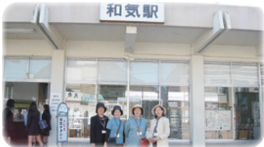
佐賀県看護連盟の役員と一緒に

全国47都道府県の連盟から約半数の連盟が拡大活動に参加するとのことでした。この活動が実を結ぶように連盟活動をしていきたいと意を強くしました。