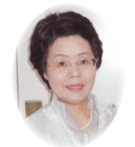
大分県看護協会会長