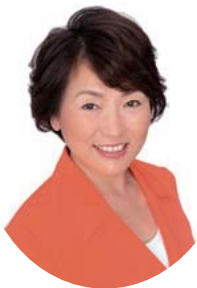
衆議院議員 あべ 俊子

看護職の教育環境と労働環境、そのどちらにおいても看護がさらにより良く発展していくためのお役に立てるよう、現場の声をお聞かせいただきながら引き続き全力で取り組んでまいります。今後とも皆様からの温かいご支援を賜りますよう心よりお願い申し上げます。