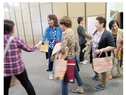
参加者の方々と固い握手 “よろしくお願いします”