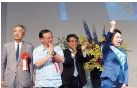
伊吹看護連会長、谷垣幹事長、石田議員、みんな応援しています。