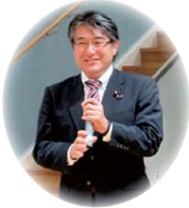
石田昌宏参議院議員