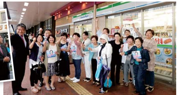
JR別府駅前にて演説 土曜の夕方、忙しい時間に、最後の選挙応援にかけつけてくれました。最後の「ガンパロー」