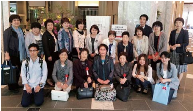
総会出席者(総会開催ホテルのホールにて)