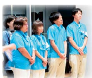
選挙カーのスタッフのみなさん 最後までお疲れさまでした。