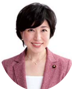
衆議院議員 木村 弥生

さて今年の4月、私は自民党京都府第三選挙区（京都市伏見区、長岡京市、向日市、大山崎町）の支部長に選任されました。今後も、光の当たらぬところにあたたかな光を当てる仕事に汗をかく政治家でありたいと思っています。皆様から頂いたご支援・ご声援を忘れることなく、皆様のご期待にそえるようしっかり成長し、新たな選挙区で頑張りますので、今後ともよろしくお願い申し上げます。