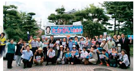
豊西苑(豊後大野市三重町) 看護職だけでなく、介護職や三重町自民党支援者の方たちが集合し「ガンパロー」