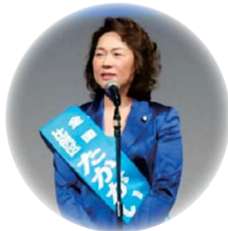
2期目の挑戦です。 よろしくお願ひします。