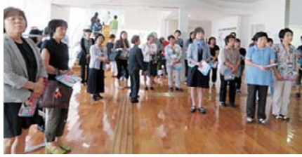
9:00より大分県看護研修会館(大分市) 石田昌宏先生の演説