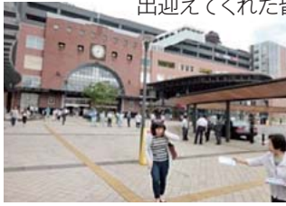
JR大分駅前(大分市) 8:00よりピラ配り