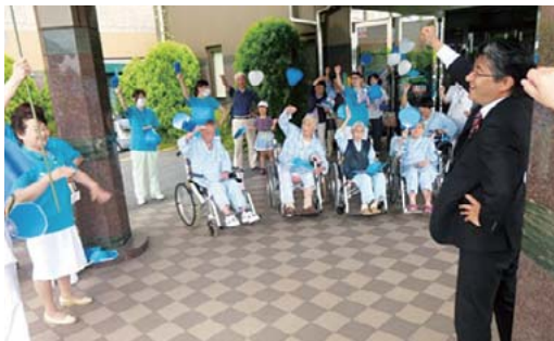
大久保病院(竹田市久住町) たかがいブルーのうちわ・風船・おそろいのポロシャツのお出迎え、保母さんや園児、患者さんと一緒に集まってくれました「ガンパロー」