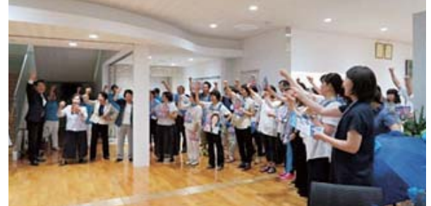
ガンパローコール