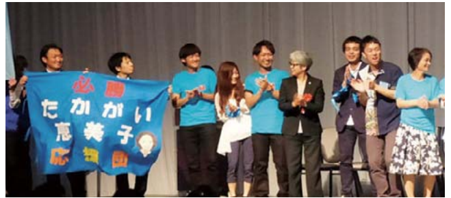
日本看護協会の坂本すが会長も各県青年部の応援団に合流