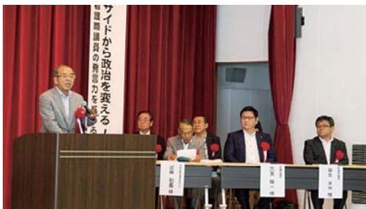
御来賓 広瀬勝貞知事・穴見陽一衆議院議員・麻生栄作県議・近藤和義県議、他議員秘書の方々

第24回参議院選挙を目前に控えての開催で、投票に結びついてほしいとの願いを込めた平成28年度通常総会です。スローガン「ベッドサイドから政治を変える～国政で看護職議員の発言力を高める～」を達成するためには上位での当選が必要です。