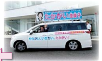
選挙カー「スマイル号」 大分県看護研修会館を出発します。行ってきます!! (^_^)〜