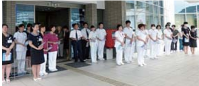
西田病院(佐伯市) 看護職、スタッフの方がお出迎えてくれました。若者が中心になり「ガンパロー」