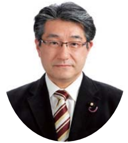
参議院議員 石田 昌宏

現場で働く皆様が「今日もいい看護ができた!」と実感し、輝きをもって看護を行うことができるよう、これからも国政の場で頑張つてまいりますので、引き続きのご支援をお願い申し上げます。