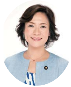
参議院議員 たかがい 恵美子

国家国民の健やかなる発展と暮らしの安寧のために、力を合わせ看護の知恵と経験そして技術を存分に活かして参りましょう。