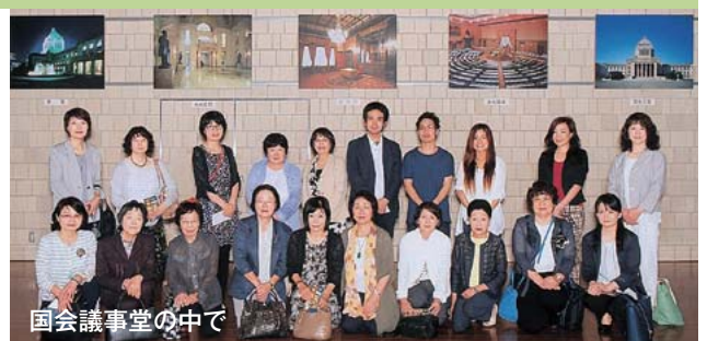
国会議事堂の中で