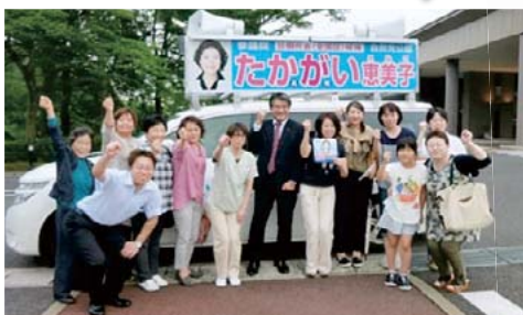
別府リハビリテーションセンター(別府市) 雨の中、スタッフが集まってくれました。「ガンパロー」