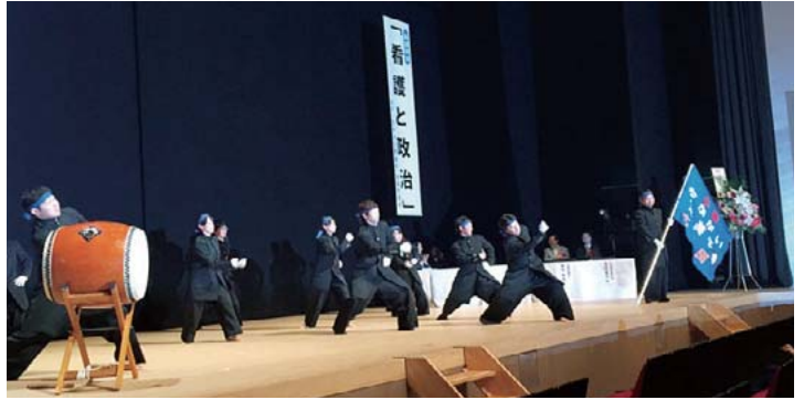
福岡県の若者の勇ましく格好いい学ラン姿にみとれました。