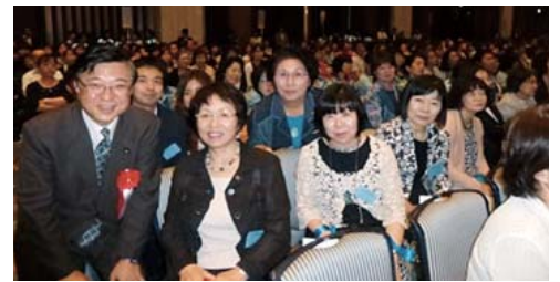
磯崎議員が代議員席まで来てくれました