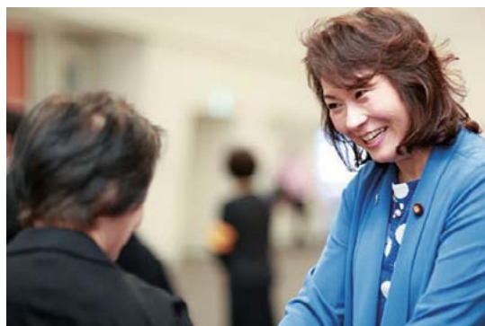
この笑顔にいつも勇気づけられます “私も頑張ります”