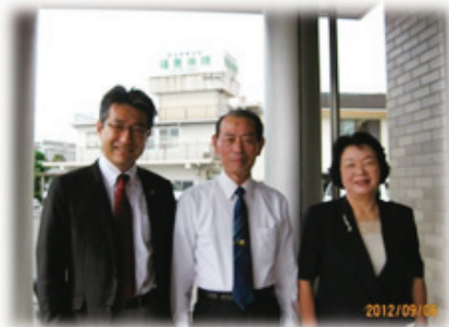
支部長のご家族も協力! 心強いです