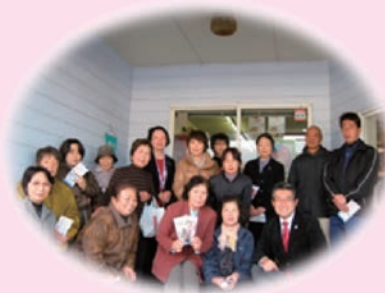
強力な支援メンバーに囲まれて