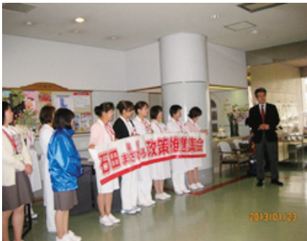
玄関で力強いことばをたくさんいただきました