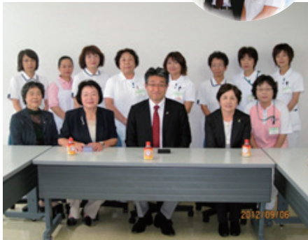
前役員の仲町看護部長とスタッフ