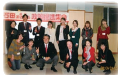
若手会員委員会メンバーとともに・・・