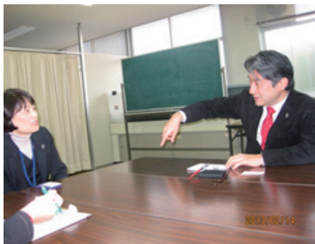
忙しい合間に現状を訴える保健師さん