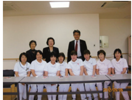
透析の専門クリニックとしての課題を伺いました