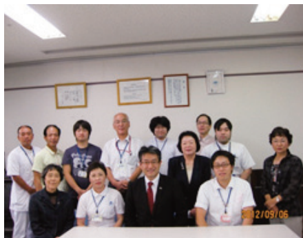
大久保病院のスタッフも一緒に・・・ 男性パワーをいただきました