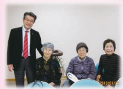
大先輩の 元ナースも駆けつけてくれました