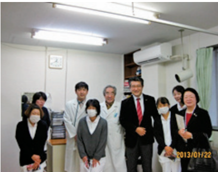
院長・副院長ともに出迎えてくれました