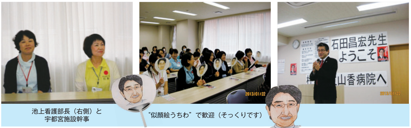
池上看護部長（右側）と 宇都宮施設幹事