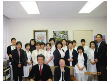
近隣の保健師さんも同席してくれました