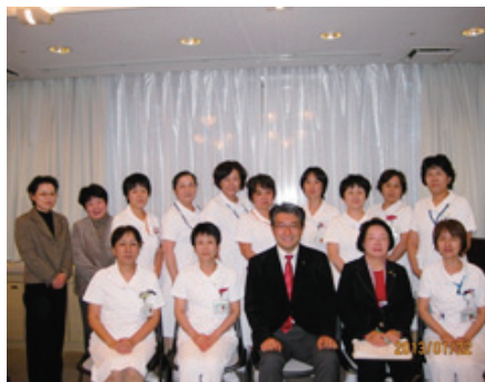
師長会におじゃましました