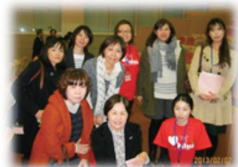
若手会員委員と一緒に・・・