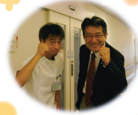
ガッツポーズ!! 帰巖会みえ病院にて・・・