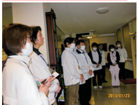
定時後にも関わらず大歓迎