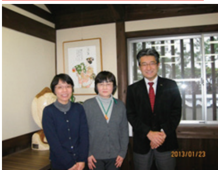
日出町の保健師のリーダーとともに