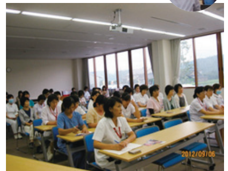
真剣なまなざしです