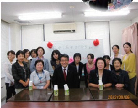
保健師さん・・・全員集合!!