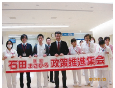
横断幕で大歓迎!! 支援の力が伝わってきました