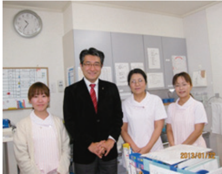
助産師さんとともに・・・