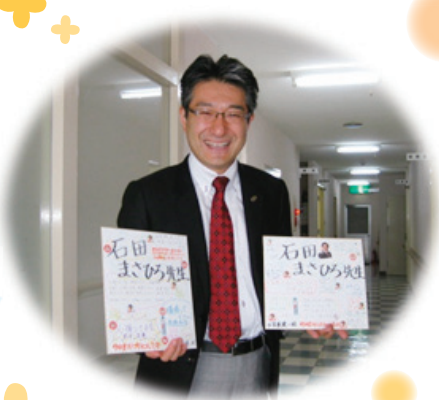
たくさんのメッセージをいただきました！