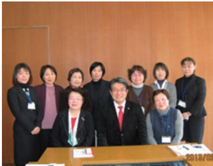
地域の老人力を活用して がんばっています