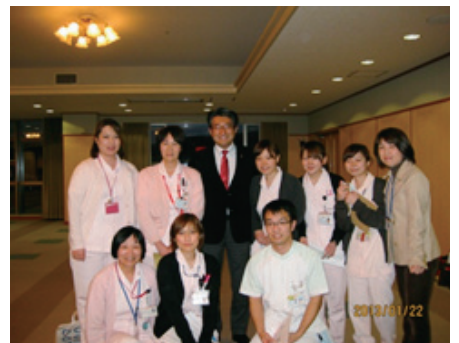
新築された病院で若いスタッフが集合