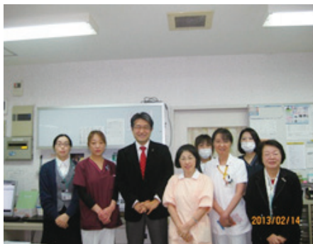
ナースステーションにて