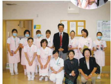
ピンクのエプロンで出迎えてくれました