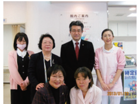
きれいな院内の植物に感動！