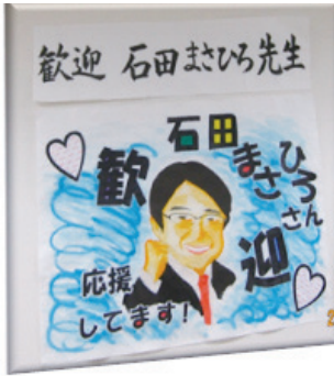
歓迎 手作りポスター