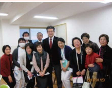
地域中核病院として大活躍