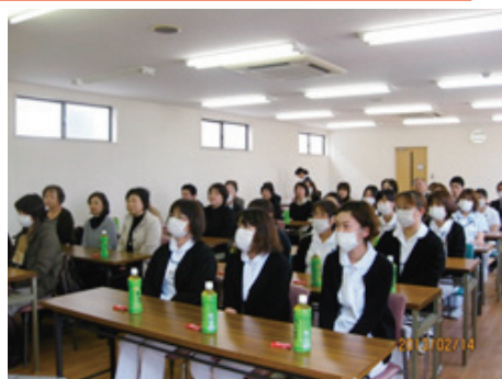
3病院合同で歓迎・・・3倍の力をいただきました