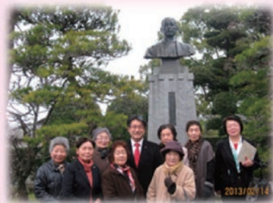
歩こう会メンバーと・・・