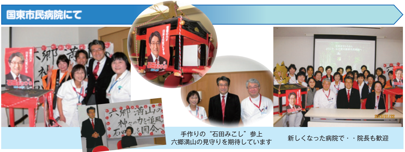
手作りの“石田みこし” 参上 六郷満山の見守りを期待しています