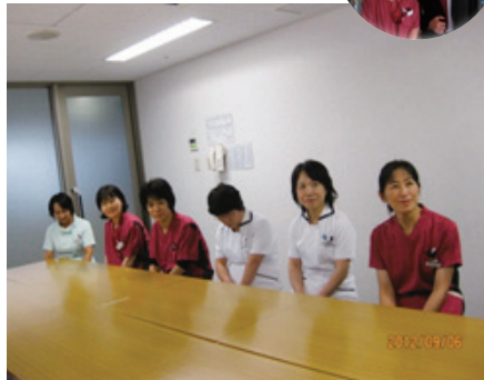
水害を乗り越えて頑張っています