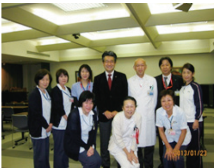
ステキな名画に囲まれて