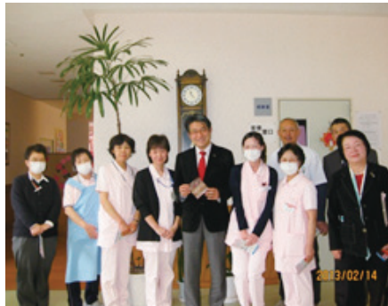
国東半島をグルリ3分の2まわり バレンタインチョコいただきました♡