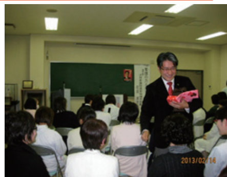
♡たくさんのバレンタインチョコと一緒にみなさんの愛と力をいただきました♡