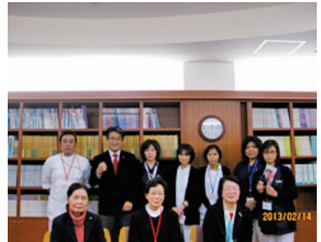
精神科の古書に大感激