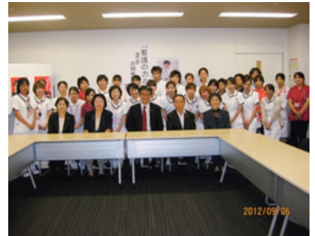
大歓迎!! ポスターもたくさん貼ってくれました