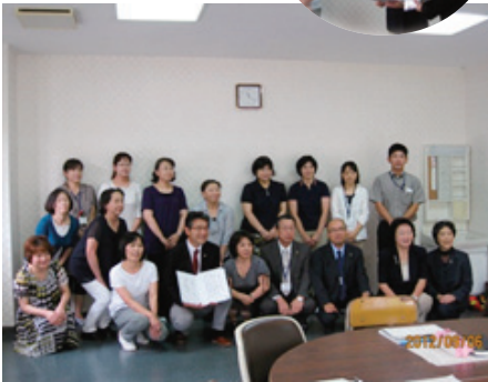
看護学校の先生方と・・・校長とも面談