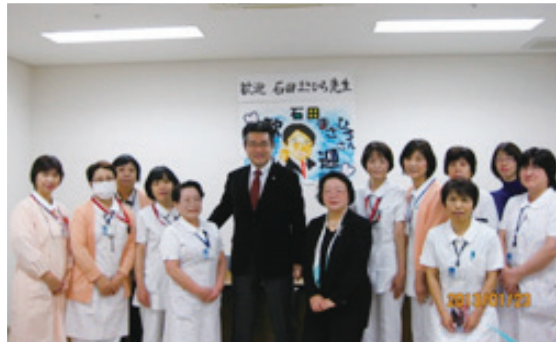
関アジ・関サバが待っているはずだった… 2階から海だけを見ました…