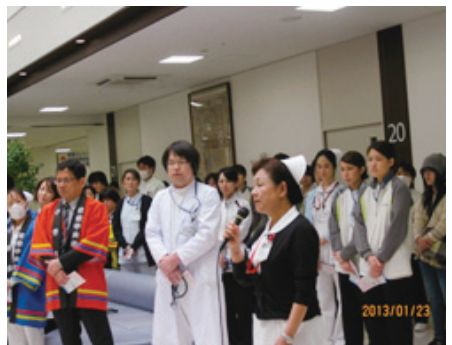
ハッピー姿で小寺院長他大勢お出迎え