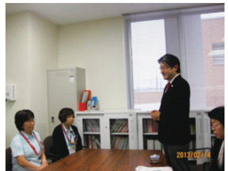
新築病院で、師長さん方とともに