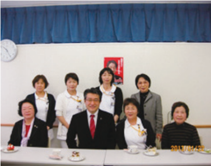
ケーキとコーヒーで歓迎