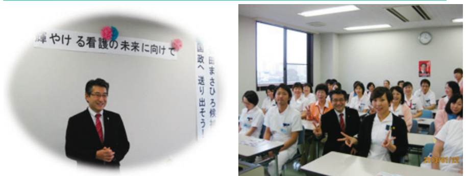
今年の夏のピースを目指してピース