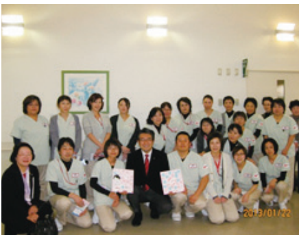
リハビリテーション施設にふざかしいナース服で、多くのスタッフが集まってくれました