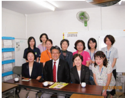
自殺防止にがんばっている 保健師さんと・・・