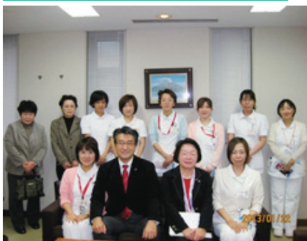
引越し寸前の登録有形文化財に 指定されている由緒ある病院で